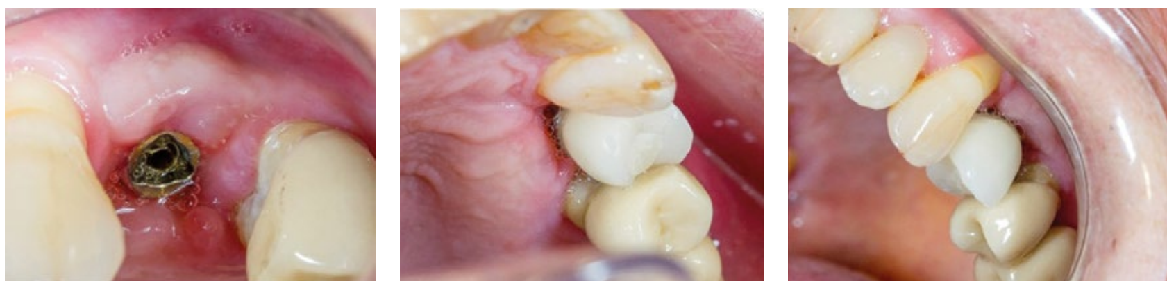
Fig. 5. Aspeto clínico da mucosa peri-implantar 15 dias após a intervenção cirúrgica.