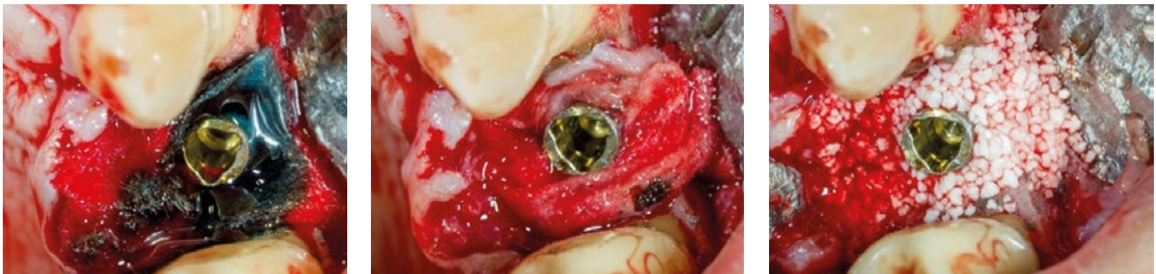
Fig. 3. Protocolo Implantsure® com aplicação do gel (ácido ortofosfórico-clorhexidina) por 2 minutos; solução antibiótica (hialuronato de sódio-piperacilina-tazobactam) por 5 minutos e enxerto ósseo com Cerasorb M® (Curasan®).